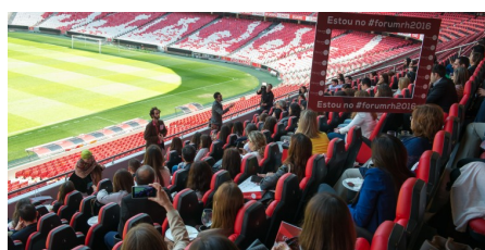
Fórum RH 2016