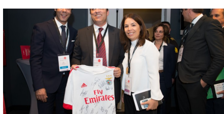
Fórum RH 2016