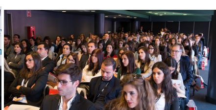
Fórum RH 2016