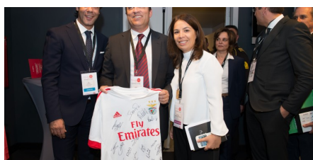
Fórum RH 2016