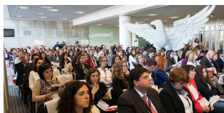
Fórum RH 2016