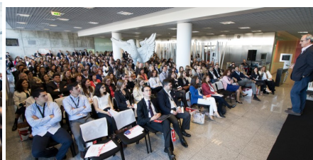
Fórum RH 2016