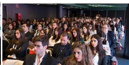
Fórum RH 2016