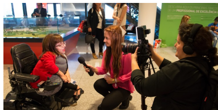
Fórum RH 2016