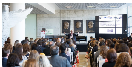
Fórum RH 2016